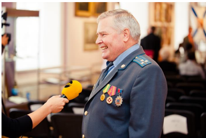
Мероприятие, посвященное 210-летию образования Минюста России

За большой вклад в развитие избирательной системы Российской Федерации Центральной избирательной комиссией Российской Федерации награжден Почетной грамотой. За добросовестный труд, умелую организацию работы, достижение высоких показателей в служебной деятельности награжден Почетной грамотой Главного управления Минюста России по ЦФО.